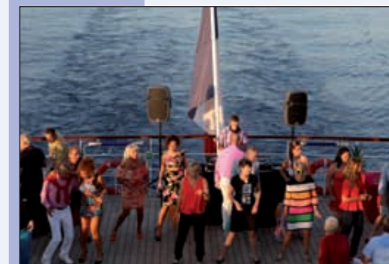
En haut, préparatifs pour le « cocktail du Commandant » dans la magique baie de Girolata, sur la côte ouest de la Corse, au sud de Calvi.